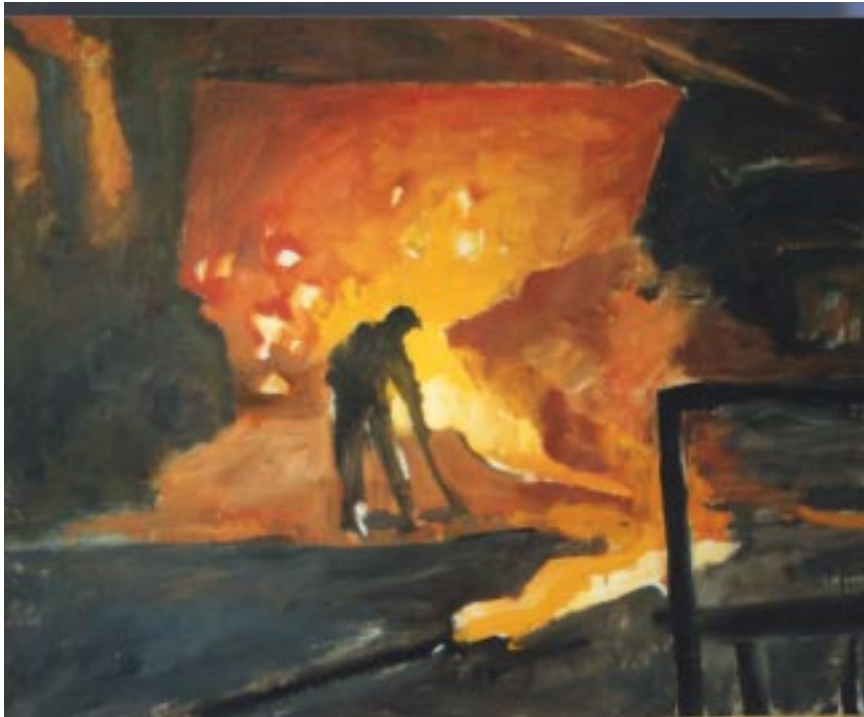
“La coulée continue” huile sur toile 80x100 cm 2002