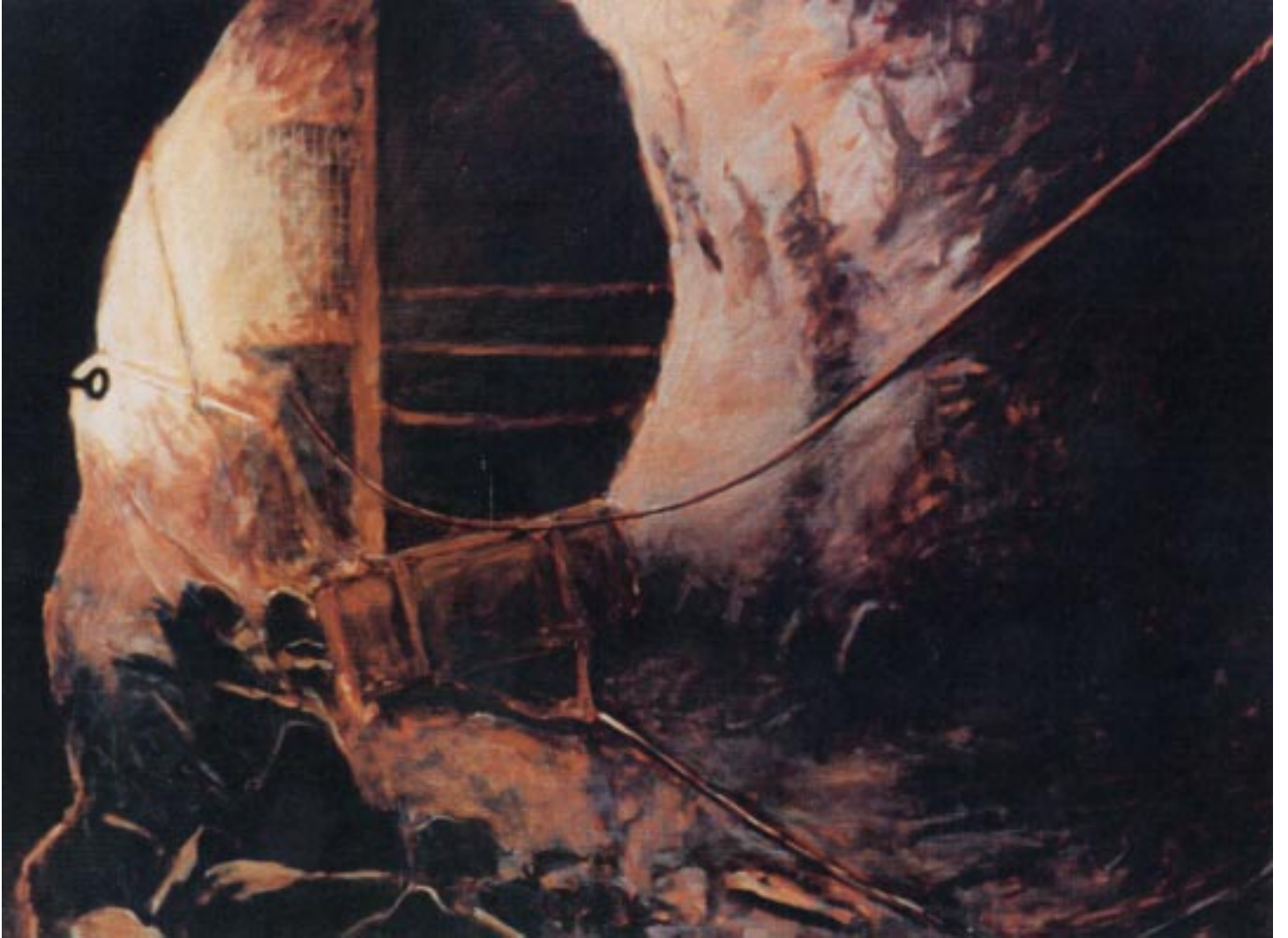
“La galerie 430 m” Huile sur toile 200x240 cm 2002