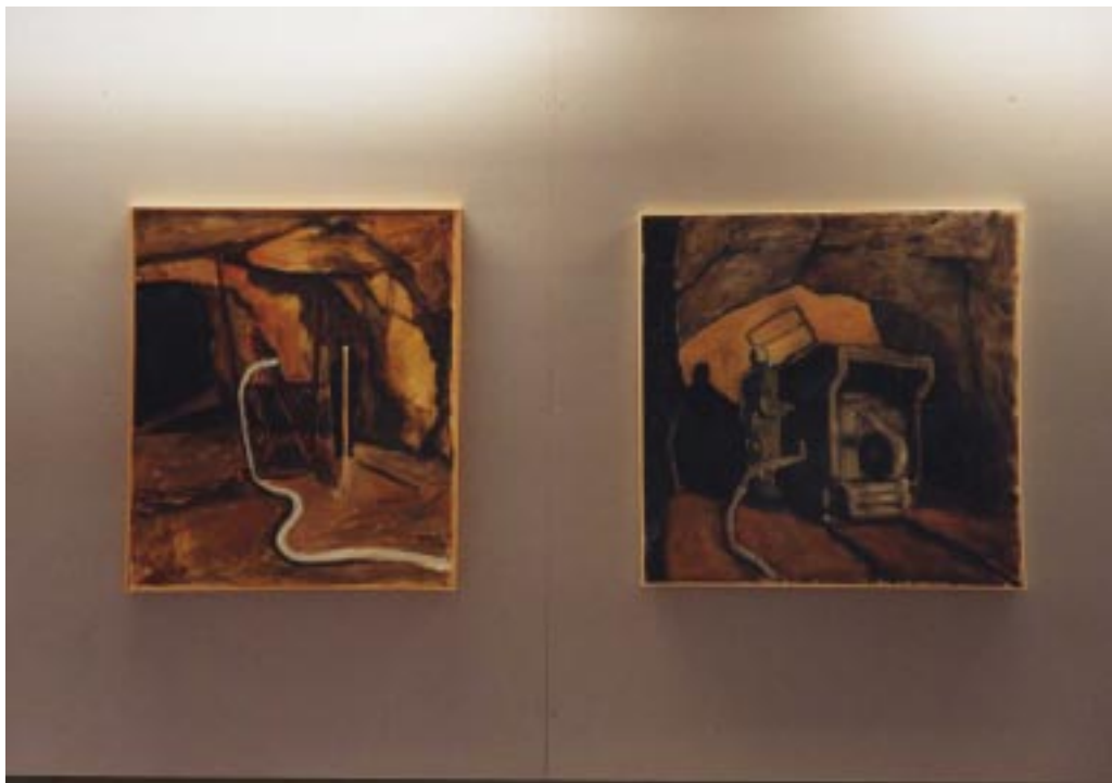
Exposition sur le thème de la mine Suède été 2002