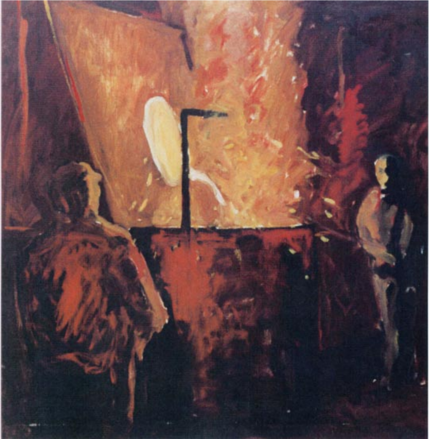
“La fonderie” huile sur toile 100x100 cm