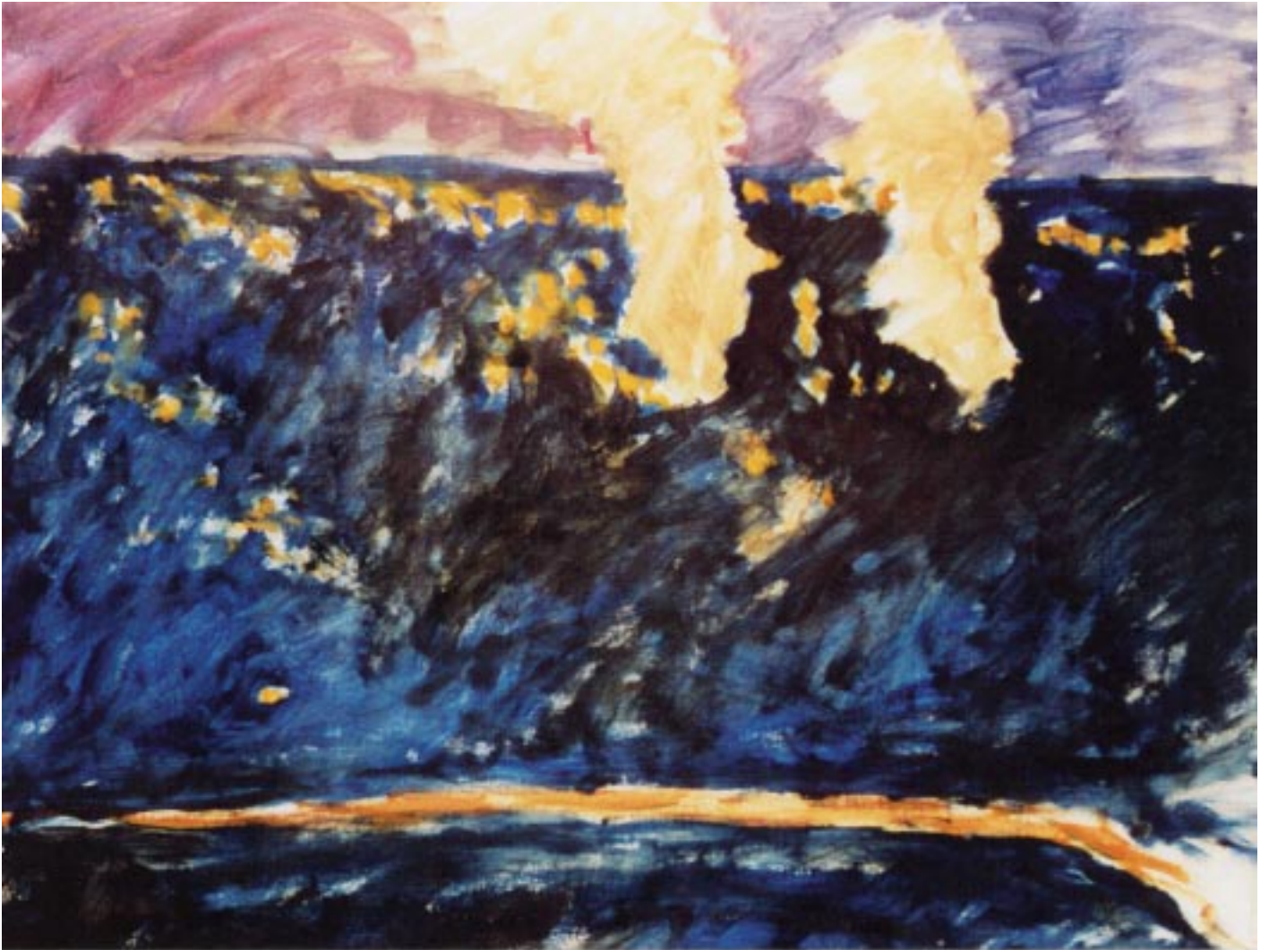
“Haut-fourneau de Seraing la nuit” Huile sur toile 210x250 cm 2002