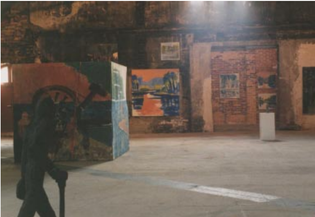
Exposition Suède 1997