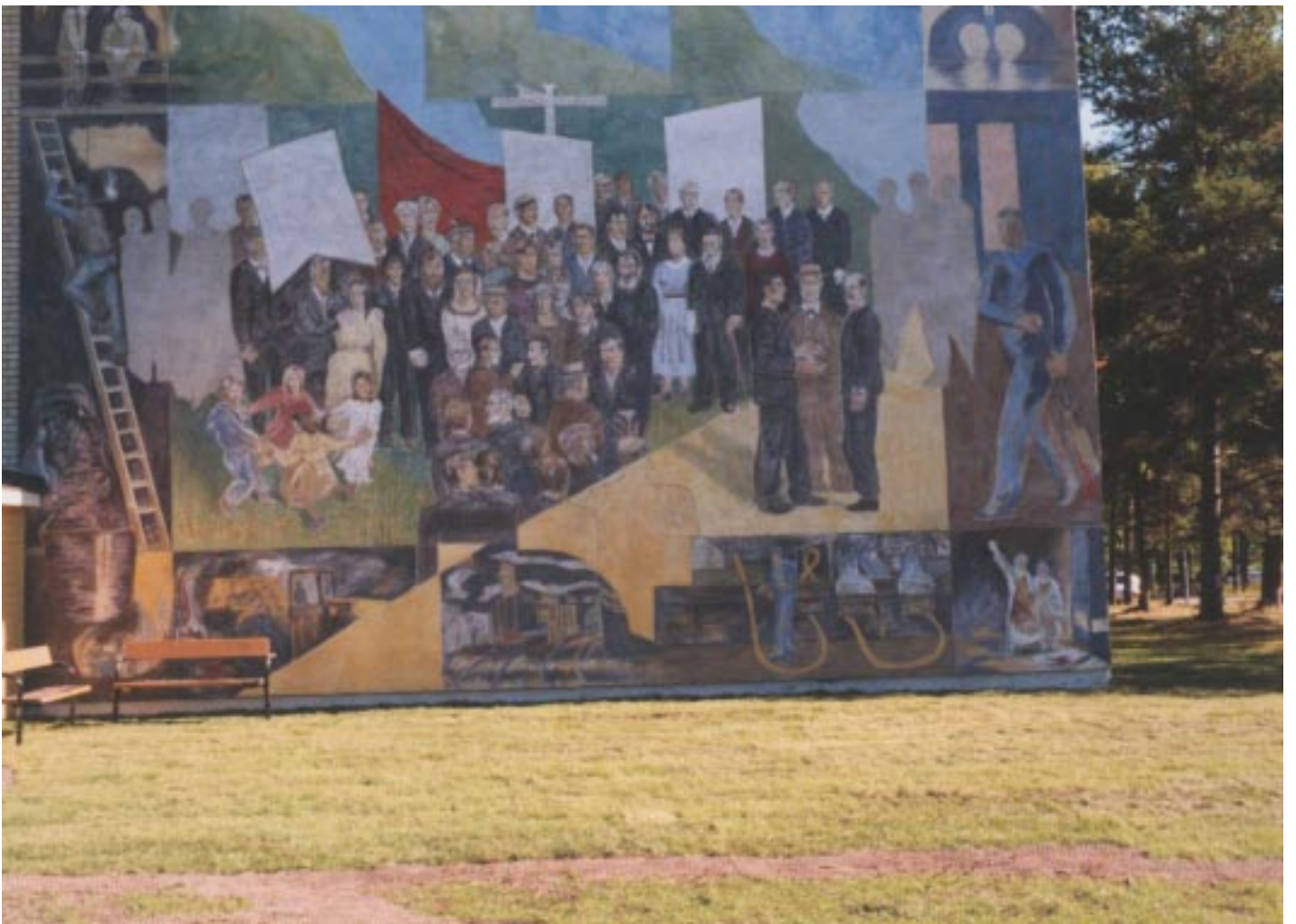
“La réunion syndicale dans le carrefour” Fresque murale 12x9 m 1996