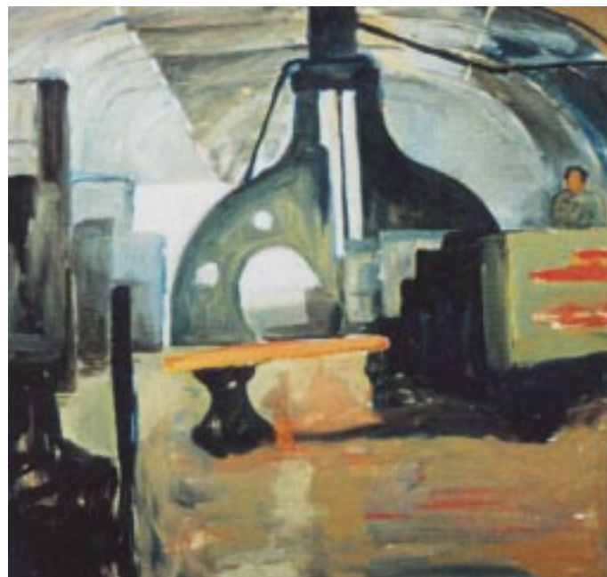
“L’intérieur de la forge” huile sur toile 100x100 cm 1997