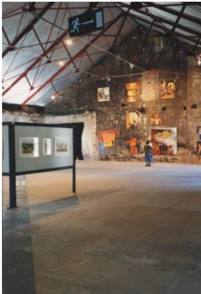
Exposition dans une ancienne forge à Osterbybruk Suède 2001