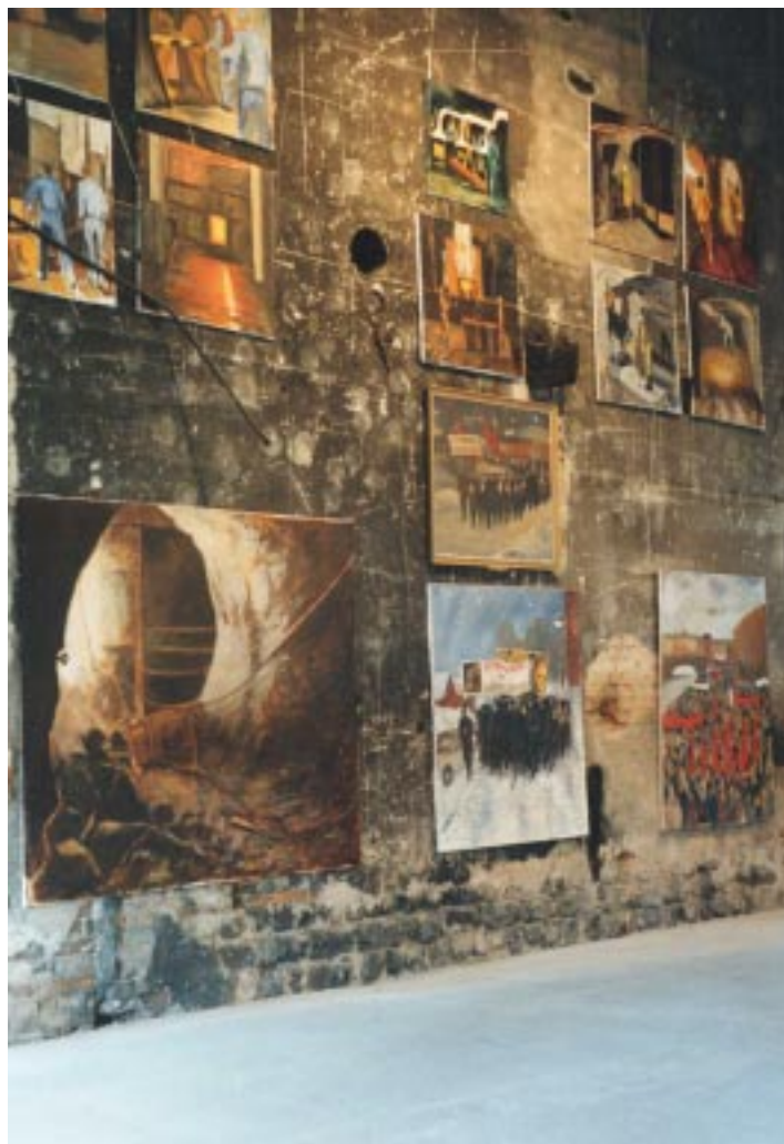
Peintures réalisées sur le thème de la Sidérurgie wallonne