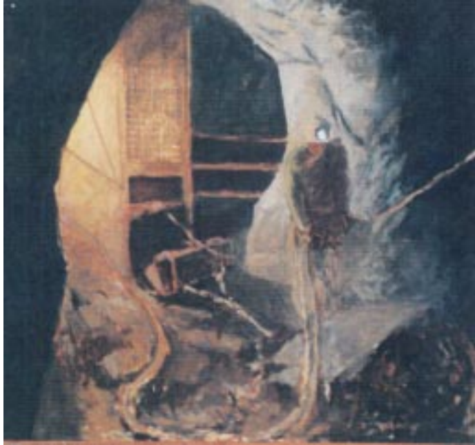
“Le foreur dans la grande pierre” huile sur toile 200x200 cm 2001