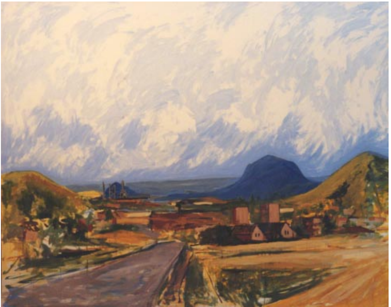
“Châtelaineau” Huile sur toile 2x2,40 m 2001