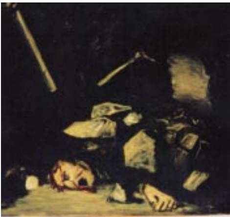
“L'accident” huile sur toile 100x120 cm 2002