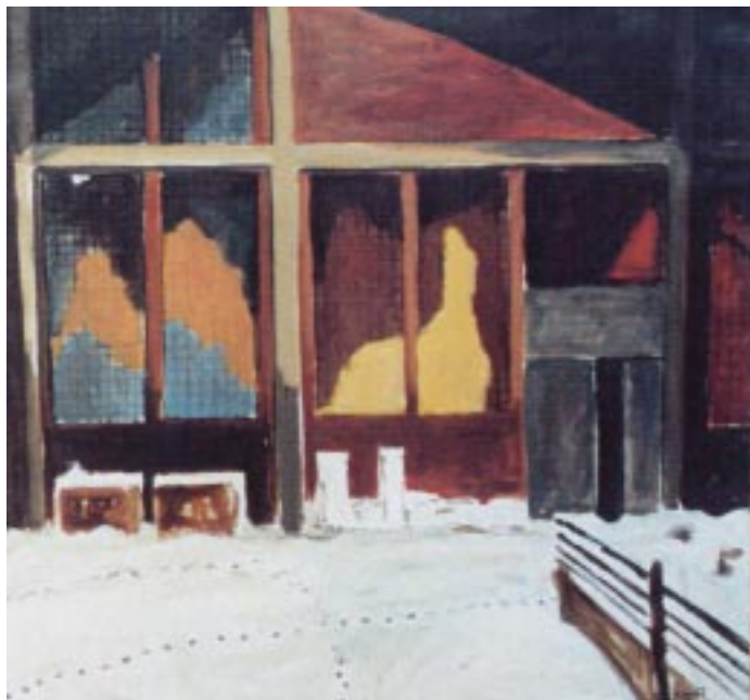
“La façade sud de la forge” huile sur toile 100x100 cm 1997