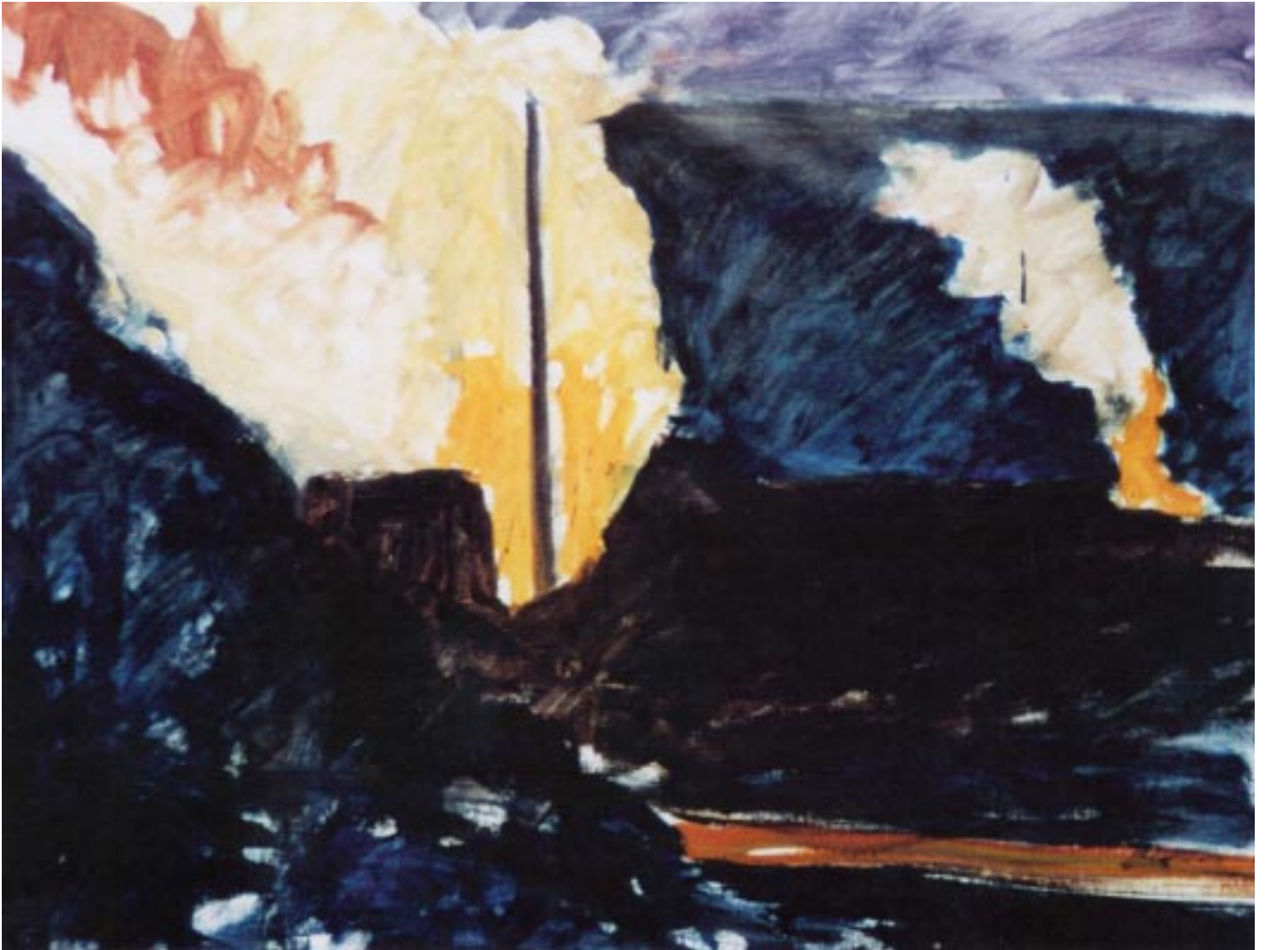
“La cokerie de Seraing la nuit” Huile sur toile 80x100 cm 1999