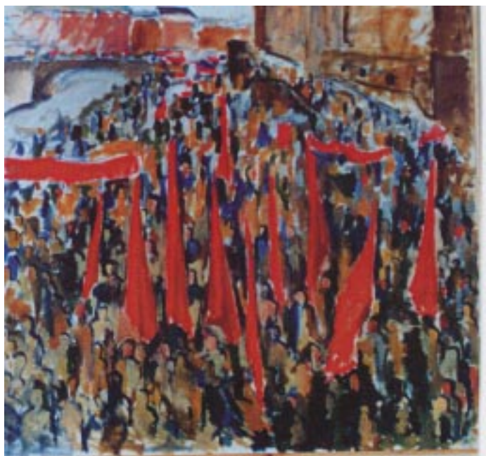
“La manifestation de Stockholm 1993” huile sur toile 100x100 cm 1994