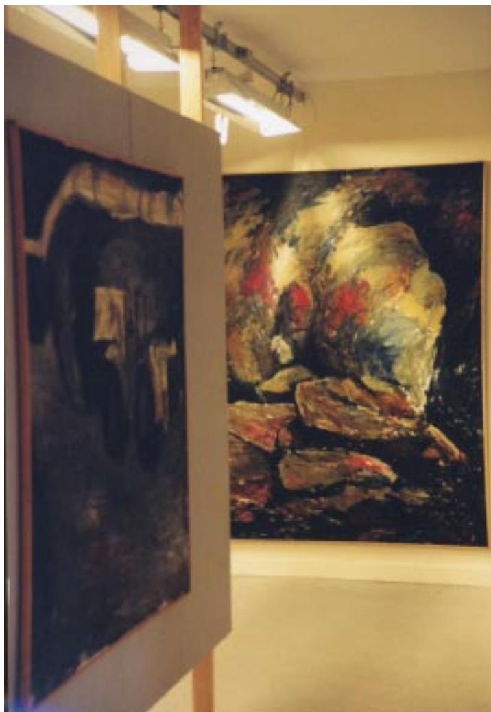
Exposition sur le thème de la mine Suède été 2002