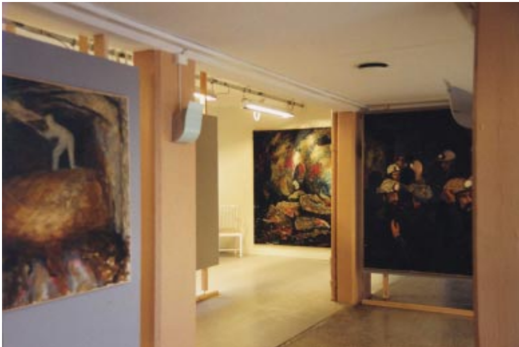
Exposition sur le thème de la mine Suède été 2002